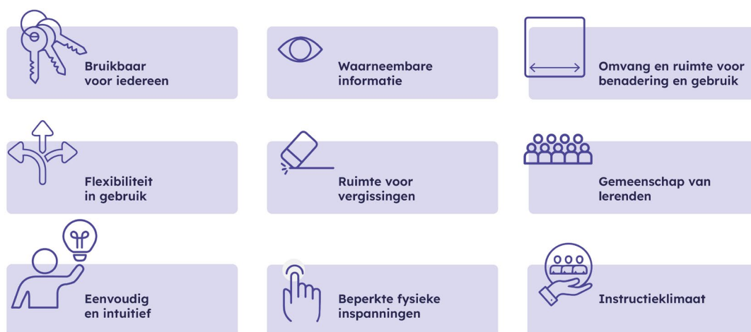
Figuur 1. Raamwerk Universal Design Instructies (2017) 13

Onderzoekers vertaalden de principes van universeel ontwerp naar de onderwijscontext in een raamwerk van negen principes: ‘Universal Design Instructies (UDI)’ (Figuur 1). 12