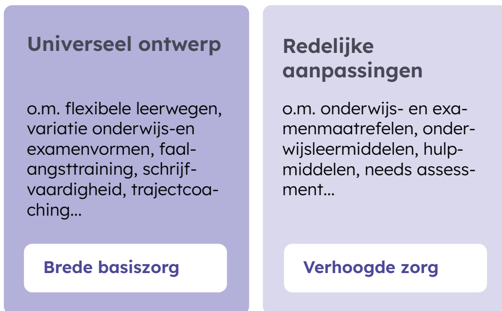
Figuur 2 - Tweesporenbeleid inclusief hoger onderwijs 28

Een groeikans voor instellingen hoger onderwijs is om het categoriale tweesporenbeleid te laten evolueren naar een zorgcontinuüm , waarbij de fase van universeel ontwerp (of brede basiszorg naar analogie van de terminologie in het leerplichtonderwijs) verder wordt uitgebouwd, en de fase van verhoogde zorg/redelijke aanpassingen (maatregelen en begeleidingen) meer in wisselwerking komt te staan met de brede basiszorg ( Figuur 3 ). 29